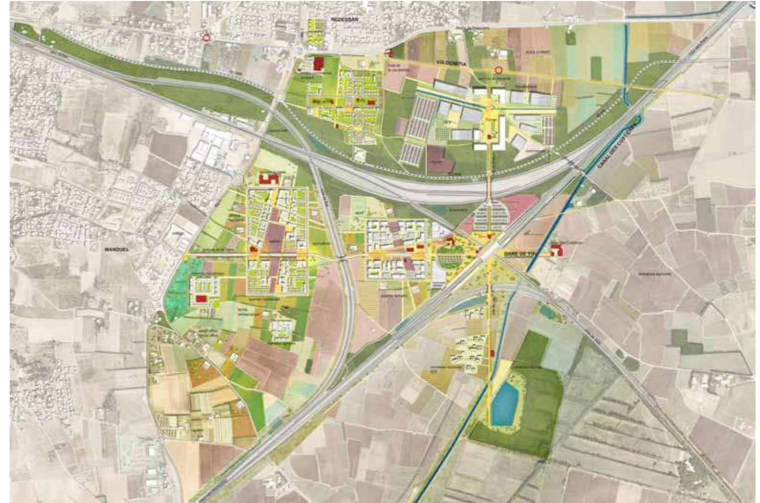
Plan masse à long terme : horizon 2040

■ Bâti projet ● Intensité urbaine / polarité ■ Objet singulier ■ Seuil de l'axe de la gare ■ Espace public majeur ■ Venelles et placettes ● Borne Via Domitia ■ Boisement ■ Vigne ■ Verger ■ Agriculture ■ Garrigue ouvert ■ Parking ■ Jardin d'accueil ■ Jardin potager ■ Mas ■ Equipement public ■ Zone humide ■ Réserve naturelle et bassin