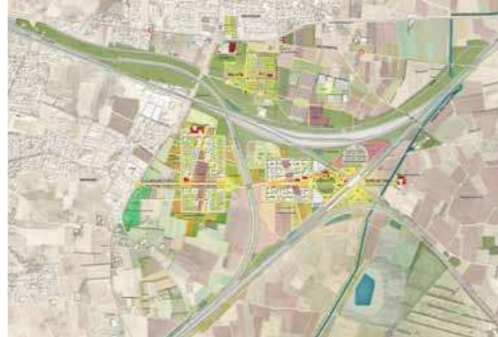
Plan masse phase 2 : horizon 2025 - 2035