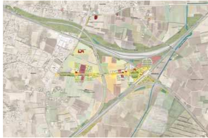
Plan masse phase 1 : horizon 2020 - 2025

Surface de plancher global : 324 000 m 2 Logements : 141 000 m 2 SDP (4 000 Habitants - 1 800 logements - 3 150 Actifs) Commerce : 18 000 m 2 SDP Bureau : 78 000 m 2 SDP Équipement : 53 000 m 2 SDP Hôtellerie : 16 500 m 2 SDP Mas : small office / home office : 18 000 m 2 SDP